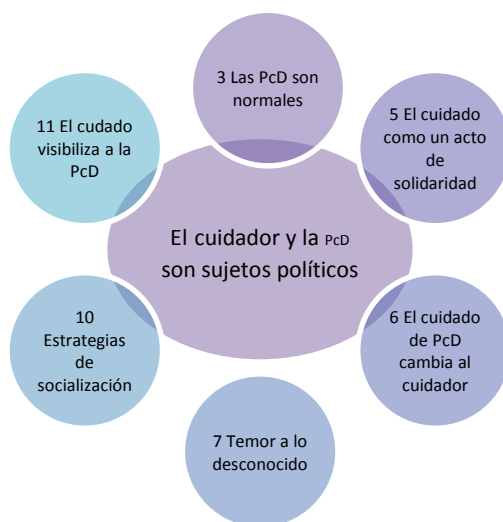
Figura 2. Categoría final 2

Categoría final 2: El cuidador y las pcd son sujetos políticos . Esta categoría resulta de las interrelaciones que se encontraron en el proceso analítico entre 6 categorías emergentes, como se muestra en la Gráfica 2. La categoría emergente 7, Temor a lo desconocido, aparece tanto en esta categoría final como en la anterior, estando presente tanto en la categoría inicial Experiencias, como en la categoría inicial Actitudes.