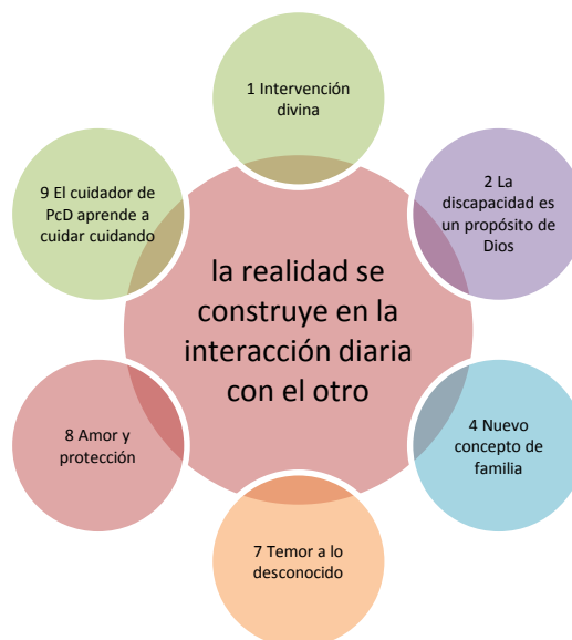
Figura 1. Categoría final 1

Categoría final 1: La realidad se construye en la interacción diaria con el otro. Esta categoría final resulta de las interrelaciones que encontramos en el proceso analítico entre seis de las categorías emergentes, como se muestra en la siguiente gráfica: