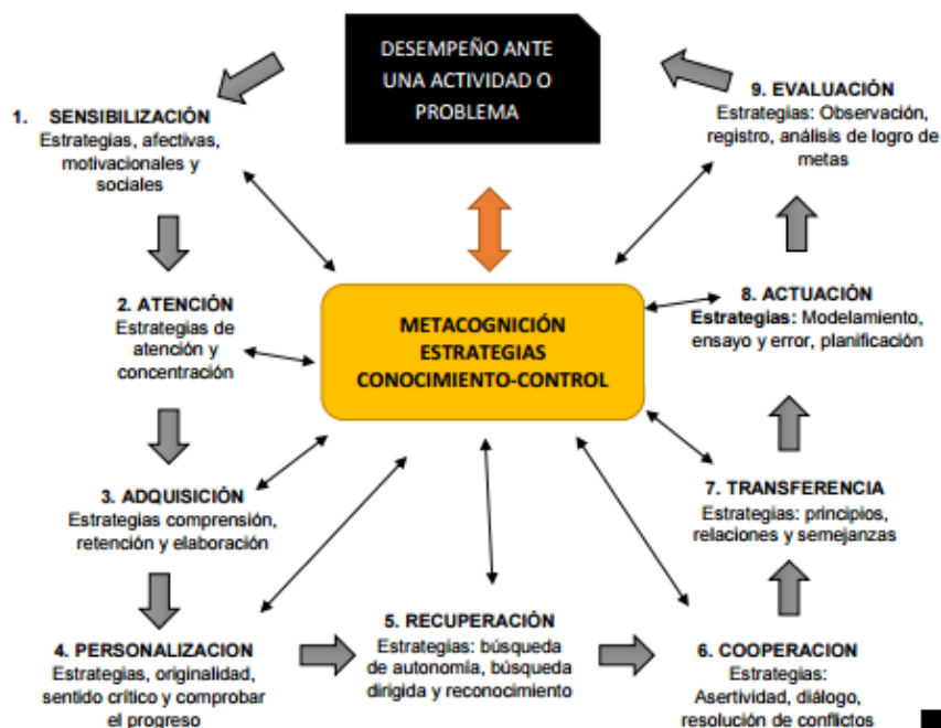
Gráfico 1 Para ello se pretende seguir lo planteado en el diseño de esta estrategia

Sensibilización: Estrategias afectivas. motivacionales y sociales. Aquí se aprovecha para realizar la ambientación del tema a tratar.