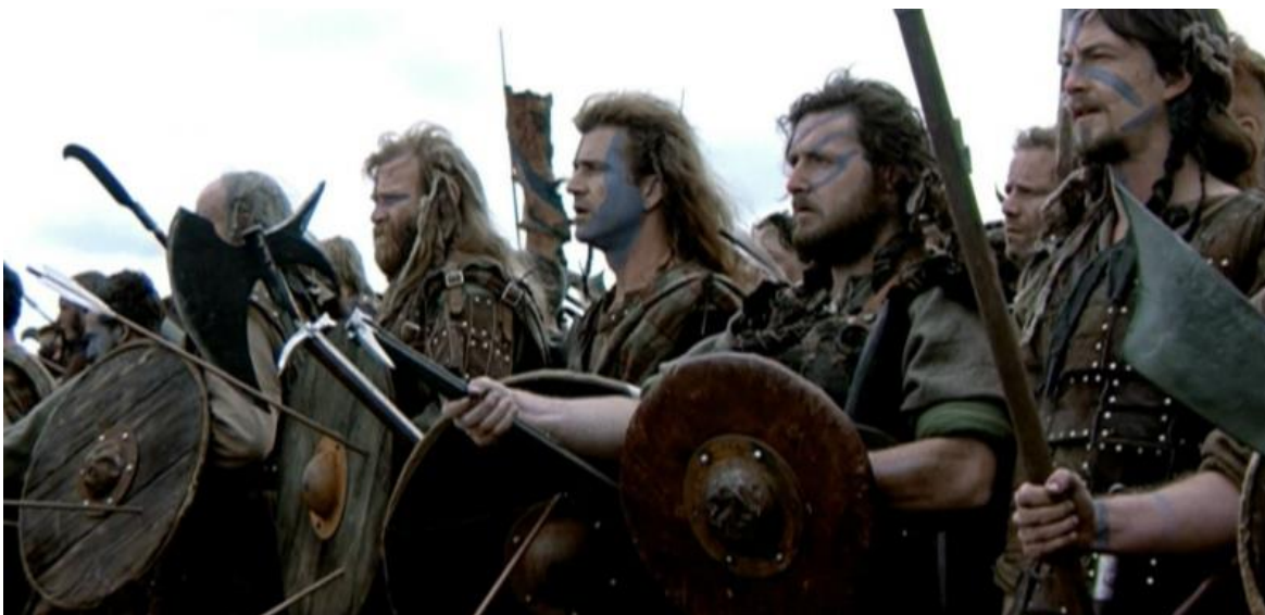
Tomado de la película Corazón Valiente